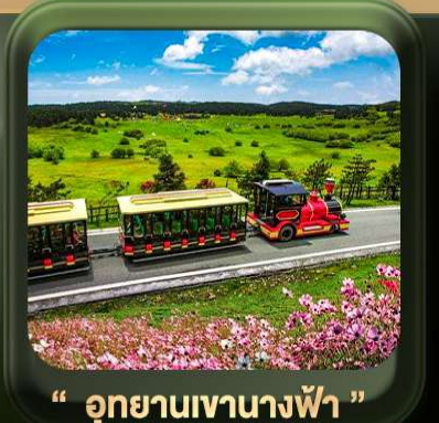
“ อุทยานเขานางฟ้า ”

T2G-CKG26CZ Special of Chongqing... วงซิ่ง ต้าจู้ อุ้หลง อุทยานหลุมฟ้า เขานางฟ้า 5D 3N (CZ)