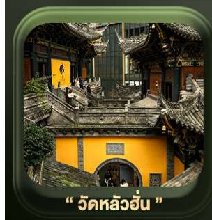
“ วัดหลิวอัน ”