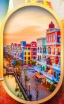
เวนิสแห่งเวียดนาม