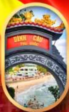
ศาลเจ้าดิงเกา