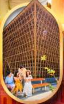
อาคารไม้ไผ่