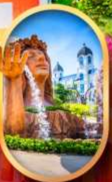
น้ำตกเทพพิหลิง