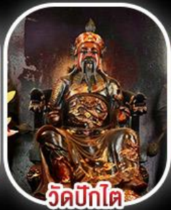
วัดบิกไค