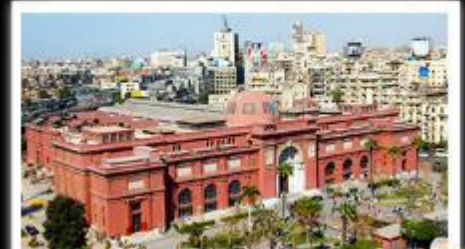
พิพิธภัณฑ์สถานแห่งชาติอียิปต์