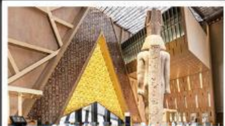
พิพิธภัณฑ์แกรนด์อียิปต์(GEM)

อารยธรรมลุ่มแม่น้ำไนล์ - พีระมิด - อเล็กซานเดรีย - เมมฟิส - ไคโร - โรงแรมระดับ 4 ดาว รวมค่าวีซ่า ครอบคลุมเอกสาร - อาหารครบทุกมื้อ