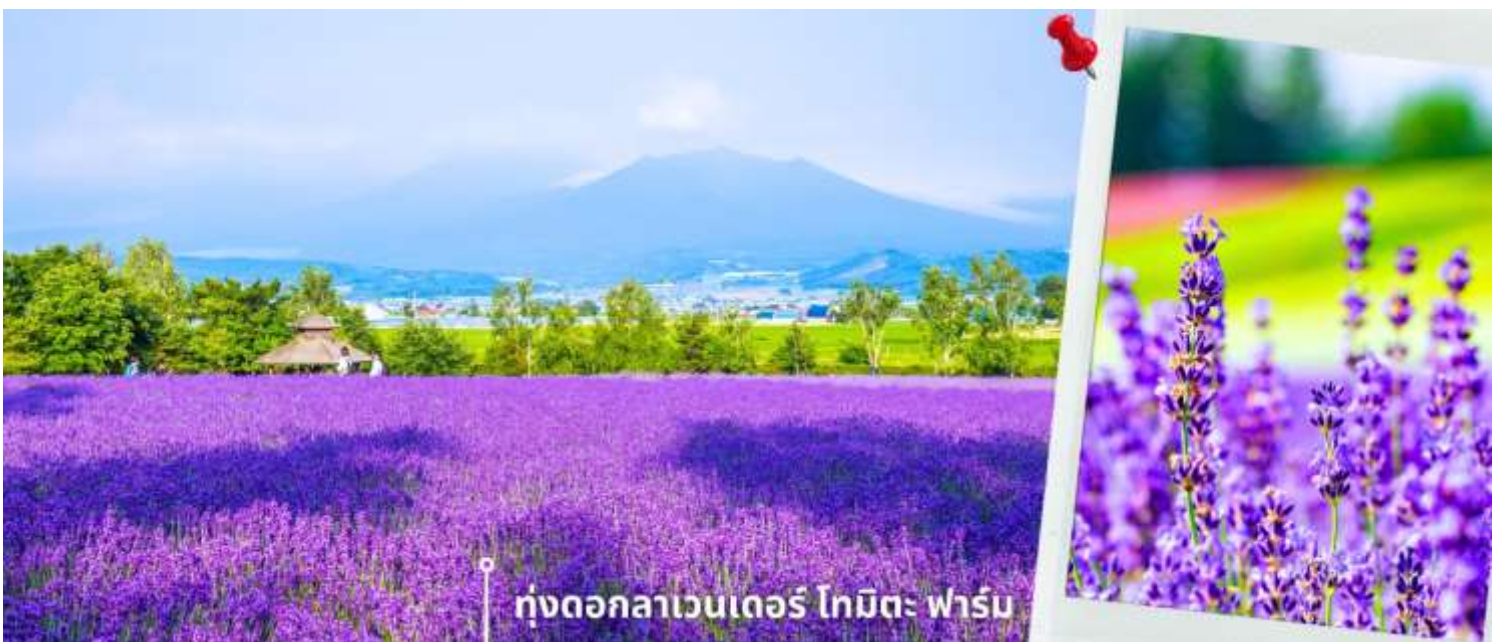
ทุ่งดอกลาเวนเดอร์ โทมิตะ ฟาร์ม

จากนั้นนำท่านเดินทางสู่ ทุ่งดอกลาเวนเดอร์ โทมิตะ ฟาร์ม ตั้งอยู่ในเมืองฟูราโนะ จังหวัดฮอกไกโด เป็นแหล่งชม ทุ่งลาเวนเดอร์ที่มีชื่อเสียงและได้รับความนิยมมากที่สุดแห่งหนึ่งของญี่ปุ่น ในช่วงฤดูร้อน ทุ่งลาเวนเดอร์จะผลิบาน เรียงรายเป็นผืนกว้าง สีม่วงสดใสตัดกับท้องฟ้าและธรรมชาติรอบด้าน สร้างทัศนียภาพที่สวยงามและเป็นเอกลักษณ์ ภายในฟาร์มมีการจัดพื้นที่อย่างเป็นระเบียบ ให้ท่านสามารถเดินชมดอกไม้ ถ่ายภาพ และเพลิดเพลินกับบรรยากาศ นอกจากนี้ยังมีร้านจำหน่ายผลิตภัณฑ์จากลาเวนเดอร์ เช่น ของที่ระลึก ขนม เครื่องดื่ม ให้ท่านได้อิสระตามอัธยาศัย