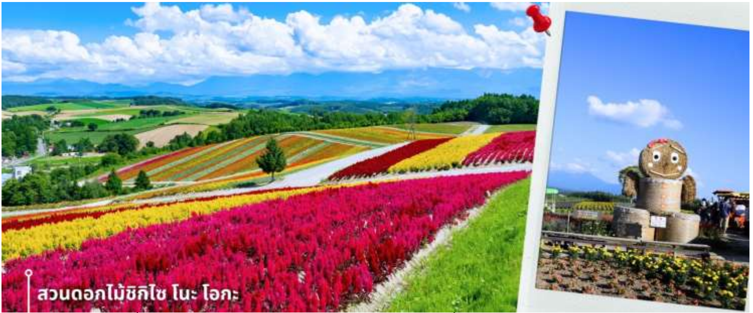
สวนดอกไม้ชิกิไซ โนะ โอะกะ

หลังรับประทานอาหารเช้า นำท่านเดินทางสู่ สวนดอกไม้ชิกิไซ โนะ โอะกะ ชื่อเต็มๆว่า Panoramic Flower Gardens Shikisai No Oka ซึ่งในช่วงซัมเมอร์จะเป็นเนินเขาสีแสนสดใสกว้างสุดสายตา พื้นที่กว่า 15 เฮกตาร์ หรือประมาณ 93 ไร่ เป็นสถานที่ที่ได้ชื่อว่า มีความสวยงามทั้ง 4 ฤดู ที่สวนแห่งนี้จะมีดอกไม้หลากหลายสายพันธุ์ ทั้ง ลาเวนเดอร์ ทิวลิป โคลเคีย ทานตะวัน และอื่นๆ มากกว่า 30 ชนิดที่สลับกันไปตามฤดูกาล อย่างในช่วงซัมเมอร์ คือช่วงเวลาที่ดี บรรดาดอกไม้และพืชพันธุ์จะบานสะพรั่งสุดสายตา พร้อมกับบรรยากาศอันสดใสรวมถึงกิจกรรมกลางแจ้งที่ท่านเพลิดเพลิน โดยแต่ละช่วงเวลาจะมีดอกไม้ประจำฤดูกาลต้อนรับในบรรยากาศสดชื่น และยัง มีทิวเขาที่งดงามเป็นเหมือนฉากหลัง ให้ท่านได้อิสระเดินชมความสวยงามและเก็บภาพความประทับใจ