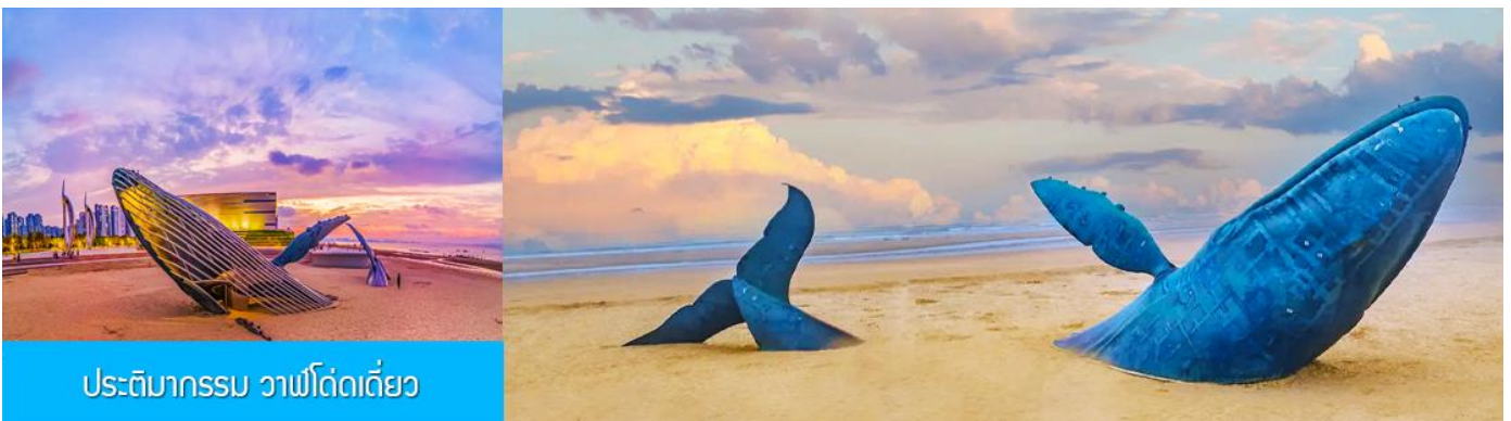
ประติมากรรม วาฬโดดเดี่ยว

นำท่านชมซุ้มประตูเมืองฝางไหล่ พระราชวังมังกร พระราชวังราชินีแห่งสวรรค์ และศาลาหลัก ชมทัศนียภาพอันตระการตาของเขตแดนทะเลเหลือง-ทะเลป้อไห่ ชม "ศาลาอมตะทะยานสู่ท้องฟ้า" จากนั้นนำท่านเดินทางไป ยังจุดชมวิวแปดเซียนข้ามทะเล ชมสถานที่สำคัญอันเป็นสัญลักษณ์ เช่น หอคอยเซียนหยวน กำแพงแปดเซียน และศาลาขู่เซียน โครงสร้างรูปทรงน้ำเต้าที่ล้อมรอบด้วยทะเลทั้งสามด้าน เชื่อมโยงตำนานแปดเซียนเข้ากับ ความมหัศจรรย์ของภาพลวงตา