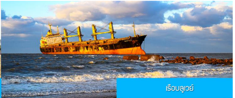
เรือบลูเวย์