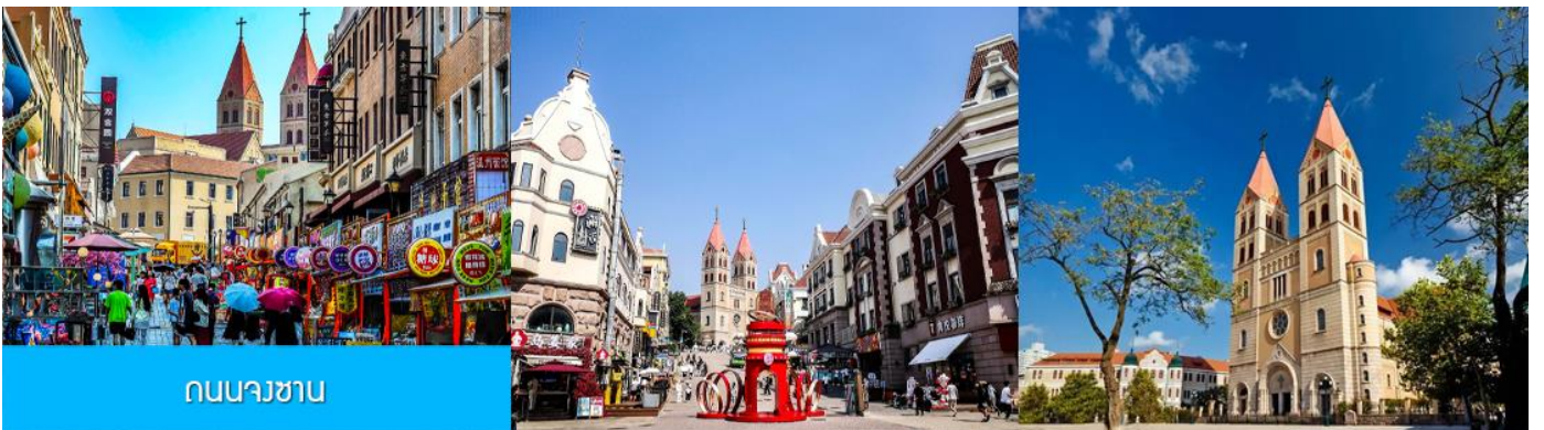
ถนนนางซาบ

หลังอาหารนำท่านเดินทางชม สะพานจ้านเจียว เป็นแลนด์มาร์กประวัติศาสตร์คู่เมืองชิงเต่า สร้างเมื่อปี ค.ศ. 1891 มีลักษณะเป็นสะพานหินทอดยาวกว่า 440 เมตรสู่ทะเล ปลายสะพานมีศาลา ทรงแปดเหลี่ยมสีแดงที่โดดเด่น ซึ่งเป็นสัญลักษณ์บนฉลากเบียร์ชิงเต่า ขึ้นชื่อเรื่องวิวสวย รับลมทะเล ให้ท่านเก็บภาพบรรยากาศ จากนั้นนำท่านเดินเที่ยวชม ถนนจงซาน 中山路 ถนนที่เต็มไปด้วยกลิ่นอายยุโรป และถนนสายนี้มีบันทึกเรื่องราวมากกว่าศตวรรษของเมืองชิงเต่าไว้ ที่นี่เป็นศูนย์กลางการค้าแห่งแรกที่เต็มไปด้วยสถาปัตยกรรมสไตล์ยุโรปเก่าแก่ที่ได้รับอิทธิพลมาจากเยอรมัน ให้ท่านได้เดินเก็บบรรยากาศ และ เก็บภาพกับ โบสถ์เซนต์ไมเคิล (ด้านนอก) โบสถ์แห่งนี้ที่คู่รักนิยมมาถ่ายภาพงานแต่งงานกันมากที่สุดในเมืองชิงเต่า ให้ท่านถ่ายรูปเก็บภาพ จากนั้นเดินทางต่อ สู่ย่าน เมืองเก่าเยอรมัน ตรอกกว้างชิงหลี่ 广兴里 ตรอกชอกชอยที่เรียงรายไปด้วยอาคารสถาปัตยกรรมแบบ ผสมผสานจีนและอาคารสไตล์ยุโรป