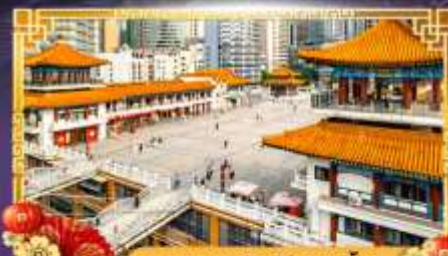
อาคารคุยซิง (ตึก 22 ชั้น)