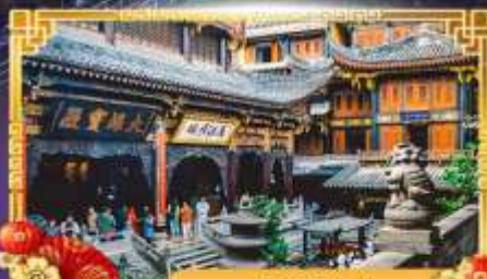
วัดหลัวหนาน