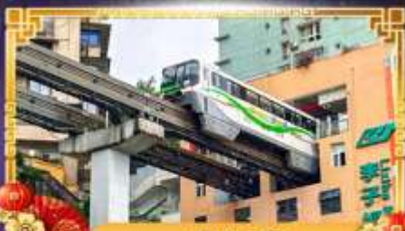
รถไฟ-ลู่ติง