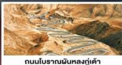
ถนนโบราณผืนหลงกู่เต้า