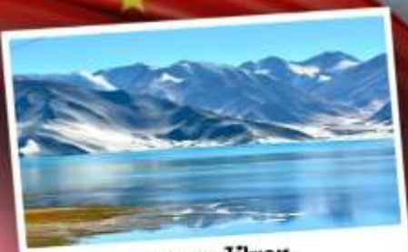
ทะเลสาบไปซาทุ

เปิดประตูสู่อารยธรรมพันปีแห่งซินเจียงใต้ ชมความสวยงามของหมู่บ้านดอกแอปเปิล