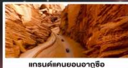
แกรนด์แคนยอนอาถูซือ