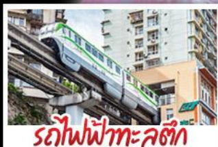
รถไฟฟ้าทะเลตึก