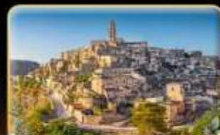
ตามรอย 007 เมือง Matera