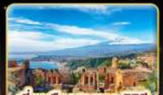
เที่ยวเมืองสวยเกาะซิซิลี Taormina