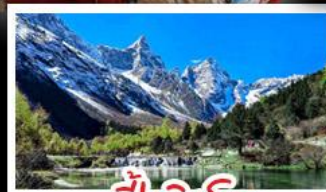
ป่าผิงโกว