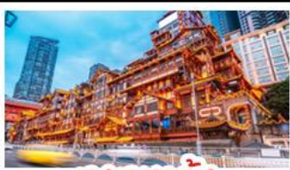
เฉิงเฉิงเฉิง

อุทยานหลุมบ่อฟ้า - อุทยานเขานางฟ้า หงหยาดัง - นั่งรถไฟทะเลสาบ - อุทยานสี่ดรุณี ป่าผิงโกว - สะพานหนานเฉียว