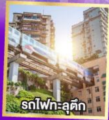
รถไฟฟ้า-ลูตัก