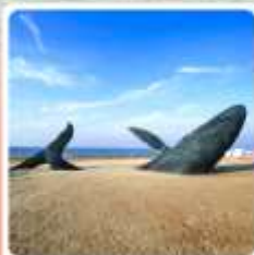
วาฬผู้โดดเดี่ยว