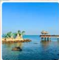
เกาะหย่างหม่า