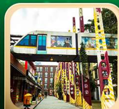
“ตงเจียวจื่อ”