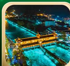
“สะพานหนานเฉียว น้ำคาสีฟ้า”