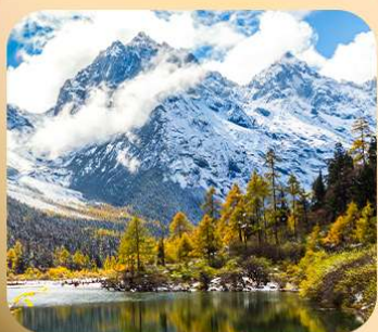
“ปี่ผิงโกว”

ชมธรรมชาติ 2 อุทยานขึ้นชื่อ อุทยานภูเขาสีดรุณี + อุทยานปี่ผิงโกว สะพานหนานเฉียว • ถนนคนเดินไท่กู่หลี่ + ซุนซีลู่ + Pop Mart • ตงเจียวจื่อ