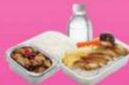
บริการอาหารร้อนบนเครื่อง ซาโป - ซากสึบ