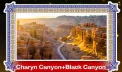
Charyn Canyon+Black Canyon