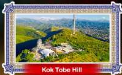
Kok Tobe Hill