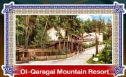
OI-Qaragai Mountain Resort