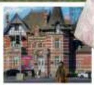
ถนนรัสเซีย