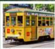
นั่งรถรางต้าเหลียน