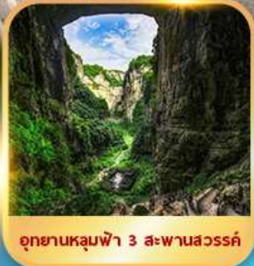
อุทยานหลุมฟ้า 3 สะพานสวรรค์