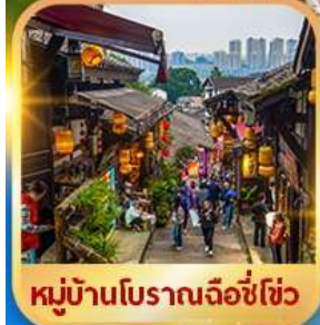
หมู่บ้านโบราณฉือโจว