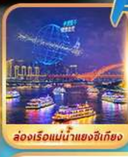
ส่องเรือแม่น้ำแยงซีเกียง