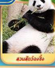
สวนสัตว์จงชิ่ง