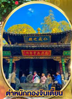
ตำหนักทองจินเตียน