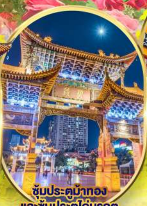
ชมประติมากรรม และ ชมประตูโถงมรกต