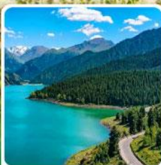
อุทยานเทียนชาน เทียนฉือ