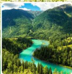
ทะเลสาบคานาสีอ