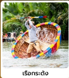
เรือกระดง

ไฮไลท์! นั่งกระเช้าขึ้น ยอดเขามานาฮิลล์ สวนสนุกแฟนตาซีปาร์ค ชมอารยธรรมโบราณแห่งเมืองฮอยอัน นั่งเรือกระดง สุดตื่นตะลึง