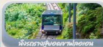
นั่งรถรางสวยอดเขาฟลอมอน