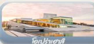
โอปราเฮาส์

สักครั้งในชีวิตกับการนั่งรถไฟสายโรแมนติกฟลัมสบนาน่า สองเรือชมฟยอร์ด ขึ้นกระเช้าลอยฟ้าพิชิตยอดเขาอูสริเคน เบอร์เกน นั่งรถรางสวยอดเขาฟลอมอนชมวิวเมือง ออสโล เยี่ยมชมโอปราเฮาส์ มหาวิหารออสโล ป้อมปราการอาครส์ฮูส สวนอนุชชาติ Vigeland Sculpture Park