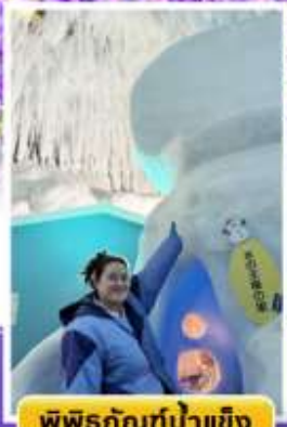
พิพิธภัณฑ์น้ำแข็ง