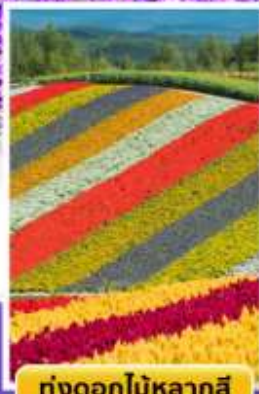
ทุ่งดอกไม้หลากสี