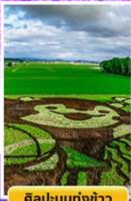
ศิลปะบนทุ่งข้าว