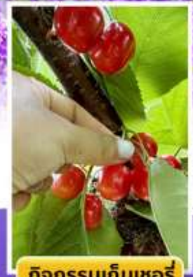
กิจกรรมเก็บเชอร์รี่

🍽️ ออนเซ็น 2 คืน 🧳 นน.กระเป๋า 23 กก. 1ใบ ☀️ 6Days 4Night