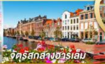
จัตุรัสกลางฮาร์เลม