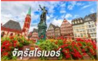
จัตุรัสโรเมอร์