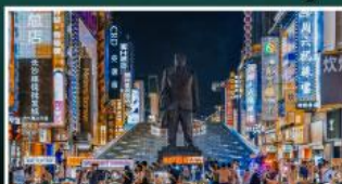
ถนนแดนเดินแดงซิงกู่