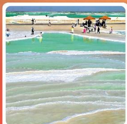
ทะเลสาบเกลือจาเอ้อหาน

ไฮไลท์! กำแพงเกาหลู กำพุทธรศิลป์โบราณ มรดกโลก UNESCO ภูเขาสายรุ้งจางเย่ ภูเขาหินสีสันแปลกตา หนึ่งในภูมิประเทศที่แปลกที่สุดในโลก