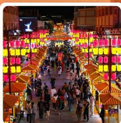
ตลาดกลางคีนซาโจว