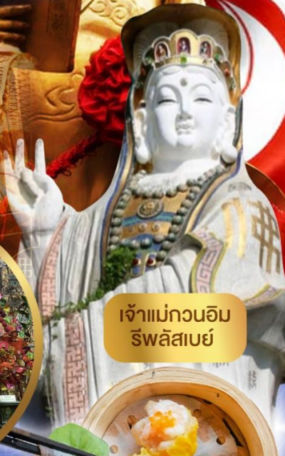
เจ้าแม่กวนอิม ริฟลิสเบย์