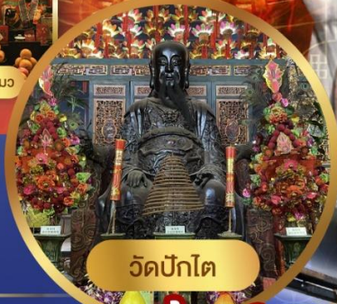
วัดปักโต