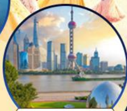
นอร์ทปิ่น กรีนแลนด์