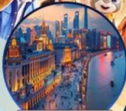
หาดไวทาน