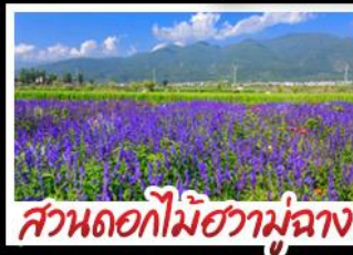
สวนดอกไม้ฮาวอวูมี๋ฉ่าง