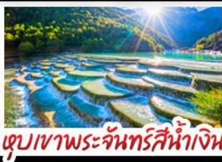
ภูเขาพระจันทร์สีน้ำเงิน

ภูเขาหิมะมังกรหยก - เมืองโบราณแชงกรี่ล่า วัดลามะซงเจี้ยนหลิน - รถไฟหิมะภูเขาหิมะมังกรหยก สวนดอกไม้ฮาวอวูมี๋ฉ่าง - เมืองโบราณลี่เจียง ภูเขาพระจันทร์สีน้ำเงิน - อนุสรณ์สถาน ลี่เจียง