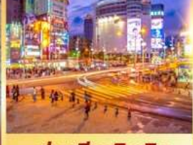
ย่านซีเหมินติง