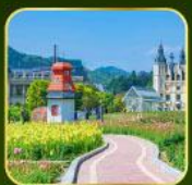
สวน Alice's Garden