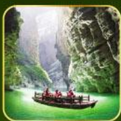
ล่องเรือแม่น้ำไตคินกุฮิว