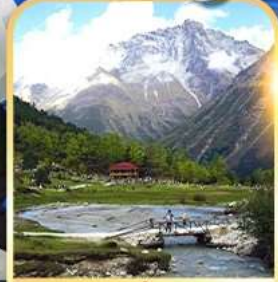
อุทยานปี้เฟิงโกว