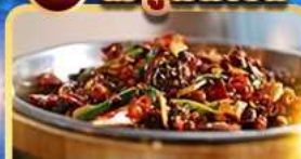
อาหารเสฉวน