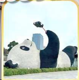
แพนต้าเซลฟี