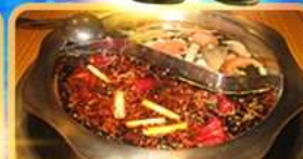
สุกี้ท้องถิ่น