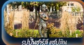
รูปปั้นซาร์ดีนี แซปลิน