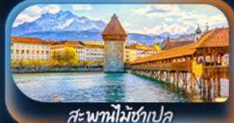
สะพานไม้ซำเปล

เที่ยวครบจบทุก Highlight ตะลุยจุงเฟรา วิวอลังการจัดเต็มสมชื่อ Top Of Europe สักครั้งในชีวิตหมู่บ้านเซอร์แมท นั่งรถไฟสาย Gornergrat bahn หมู่บ้านเลาเทอร์บรุนเนินสวยเหมือนเทพนิยาย เปิดประสบการณ์โรแมนติกส่องเรือทะเลสาบรุน ทะเลสาบเจนีวา น้ำพุจรวดเจ๊กโค ศาลาไทย รูปปั้นซาร์ดีนี แซปลิน The Fork ปราสาทซิลยอง หมู่บ้านอิชลทอวอลด์ สิงโตแกะสลัก สะพานไม้ซำเปล โบสถ์ฟรอนนุสเตอร์ ซ็อบบิงจุงอนบานโฮฟชตราเซอร์