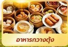
อาหารกวางตุ้ง