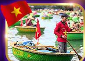
เรือกระด้ง หมู่บ้านก๊อตัน