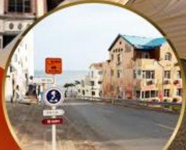
ถนนอ่าวจีป่า