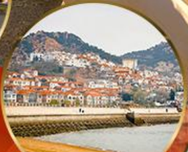
ซาจี้โข่ว