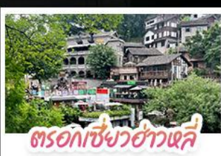
ตรอกเซียวฮ่าวเฉี