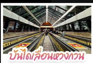
บันไดเลื่อนแขวงกาน