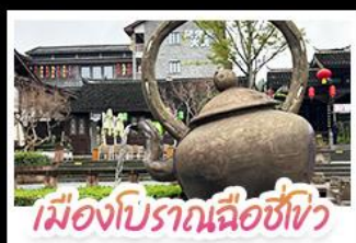
เมืองโบราณฉือชิว