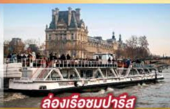
ล่องเรือชมปารีส