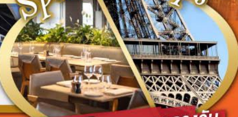
รับประทานอาหารกลางวันบนหอไอเฟล

ไฮไลท์ในโปรแกรม • สะพานไมชาเปเล ลูเซิร์น