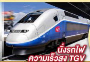
นั่งรถไฟความเร็วสูง TGV