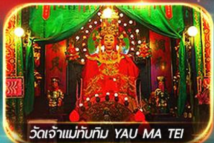
วัดเจ้าแม่ทับทิม YAU MA TEI