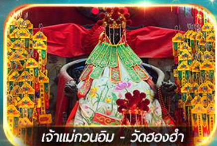
เจ้าแม่กวนอิม - วัดสองอ้า