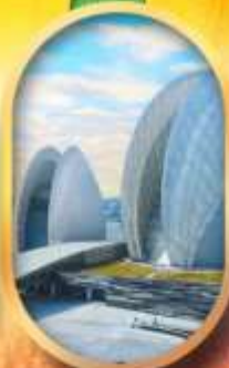
โรส-ครีโซมุก