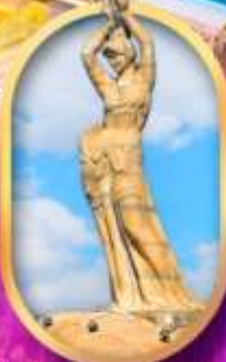
เด็กหญิงชาวประมง