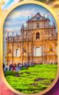
โบสถ์เซนต์พอล