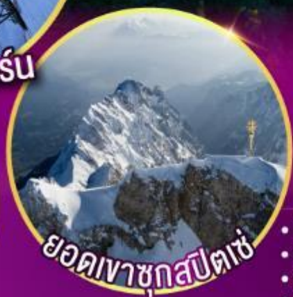
ยอดเขาชุกสปีตเซ