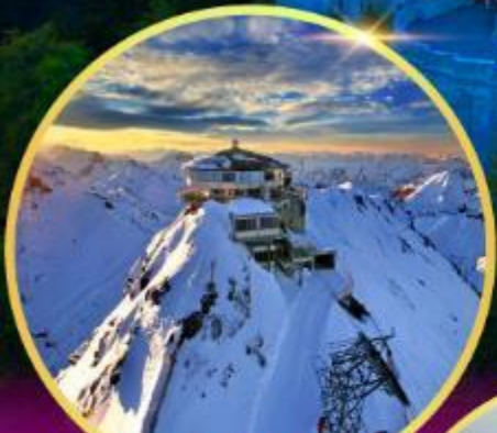
ยอดเขาซิลรอร์น