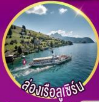
ล่องเรือลูซิิร์น