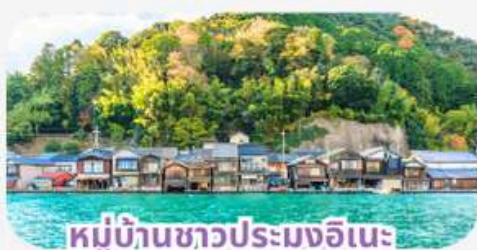
หมู่บ้านชาวประมงอินะ