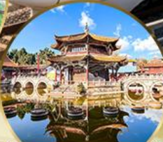
วัดหยวนทอง