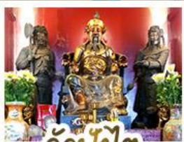
วั้ดปี้กั้โต