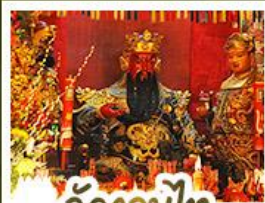
วั้ดกวนน้้ไท