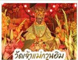
วั้ดเจ้าแม่กวนอิมอ้องฮ้า