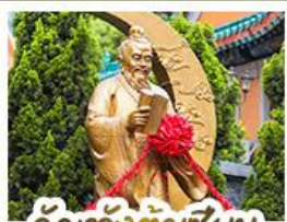
วั้ดแะวั้งต้้าเซ้าเซ็ง