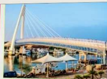
สะพานคู่รักตั้นสุ่ย