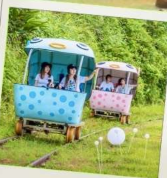
Shen'ao Rail Bike