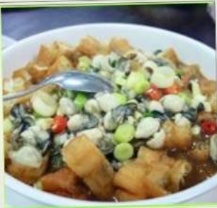
ถนนโบราณสี้อเฟิ่น