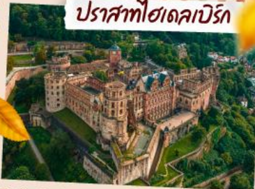
ปราสาทโชนเลเปิร์ก