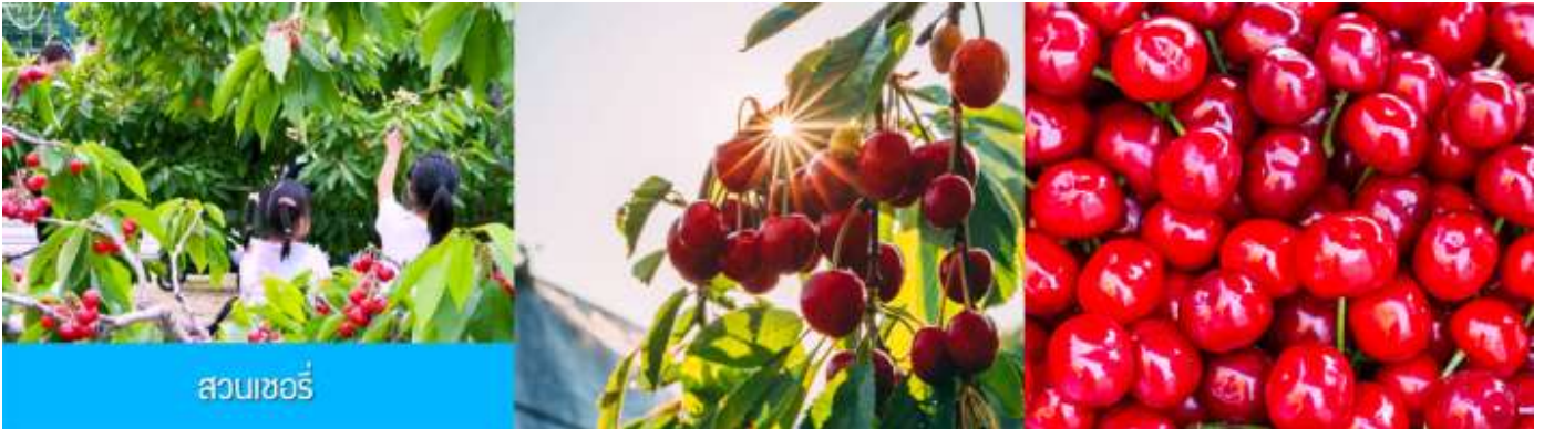
สวนเชอร์รี่

เช้า รับประทานอาหารเช้า ณ ห้องอาหารของโรงแรม (10)