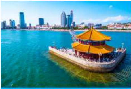
สะพานเจี้ยนเถียว