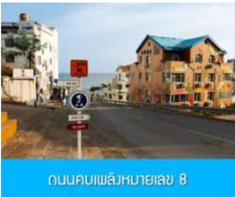
ถนนคอบเพลิงหมายเลข 8

นำท่านชมสวนสาธารณะเว่ยไห่ 威海公园 สวนสาธารณะริมทะเลที่ใหญ่ที่สุดของเมืองเว่ยไห่ ให้ท่านชมและถ่ายภาพคู่กับ กรอบรูปยักษ์วิวทะเล 威海公园大相框 แลนด์มาร์คที่เป็นอีกหนึ่งไฮไลท์ที่สุดฮิตของเว่ยไห่