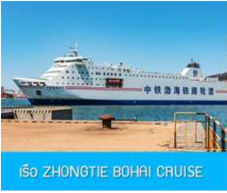
เรือ ZHONGTIE BOHAI CRUISE