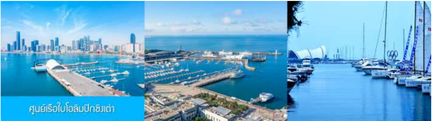
ศูนย์เรือใบโอลิมปิกชิงเต่า

จากนั้นนำท่านเที่ยวชม โรงเบียร์ชิงเต่า 青岛啤酒博物馆 พิพิธภัณฑ์เบียร์ที่ขึ้นชื่อของเมืองชิงเต่า ซึ่งเป็นเบียร์ยี่ห้อแรกที่ผลิตขึ้นในประเทศจีน ชมเบียร์ คอลเลกชันที่มียี่ห้อหลากหลายที่สุดของโลก และชมการจัดแสดงภาพและวิดิทัศน์เกี่ยวกับวิวัฒนาการของเบียร์ ขั้นตอนการผลิตและอื่น ๆ ที่เกี่ยวข้อง พร้อมชิมเบียร์ชิงเต่า ซึ่งเป็นเบียร์ที่ขายดีที่สุดยี่ห้อหนึ่งของจีน.. (ชิมเบียร์ชิงเต่าท่านละ 1 แก้ว รับกลับอีก 1 ขวดเล็ก ตอนเดินออก)