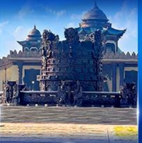
ศูนย์วัฒนธรรม มองโกเลีย หยวนหลิว