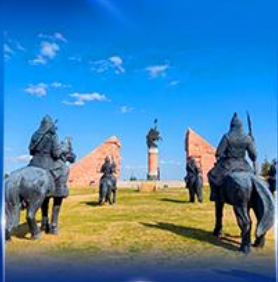
สวนสาธารณะเจงกิสข่าน