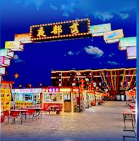
ตลาดกลางคืน ตาลาเดออี