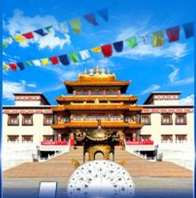
วัดพระโพธิสัตว์ อูลาน